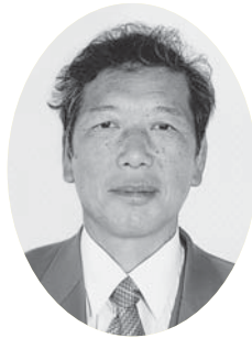
山中 進 議員