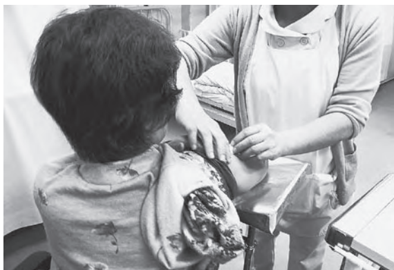
肺炎球菌の予防接種