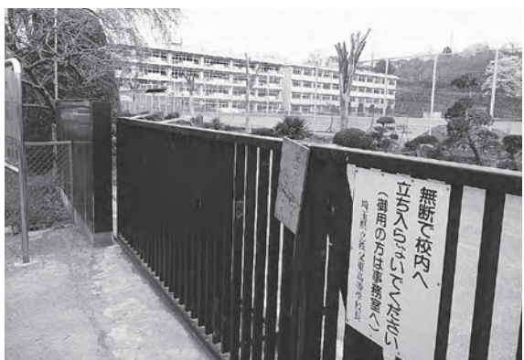
旧秩父東高等学校