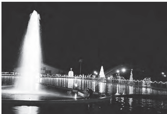
ミュージックパークのイルミネーション

問 公共施設に太陽光発電導入は。子どもたちへの環境教育や市民への普及啓発の面からも大変重要。緊急時の非常用電源にも活用