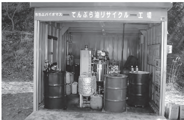
てんぷら油リサイクル工場

油燃料で動いている。21年度はこれを10台に増やす予定。課題は、廃食油の回収量を増やすこと。また、障がいのある人の雇用については、社会福祉協議会との連携を深めながら検討していく。