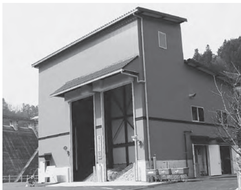
バイオマス発電所

答 旧埼玉三興の汚水処理については、市も排水の検査を行うと共に排水も万全をきす。1年後の水処理も業者・埼玉県に要請。旧武蔵開発協会の汚水は県と協議する。