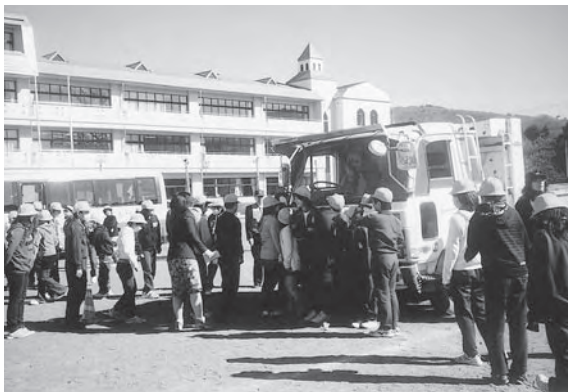
学童の交通事故防止教室 大型車による体験学習

問 秩父、吉田、大滝、荒川地域の現状と問題点。県の緑策と併せ混合林の育林業の計画的森林対策。私有林は3291haで、各地域毎に枝打ち、間伐等育林実施中。