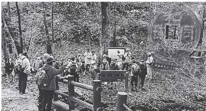
和銅遺跡とみの山ハイキング・和銅露天掘跡にて

問 21年度秩父市の重点施策は。 答 市政対話集会、議会の政策提言、市民の要望等集約し予算編成。