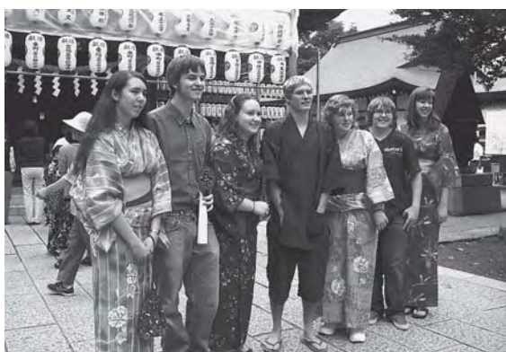
川瀬祭を観光する姉妹都市の学生たち

答 秩父市の有する起伏の激しい地形に「電動自転車」は有効な移動手段であると考え、今後、実験を行い、関係機関と協議しながら、レンタサイクル開業の準備を進めていく。